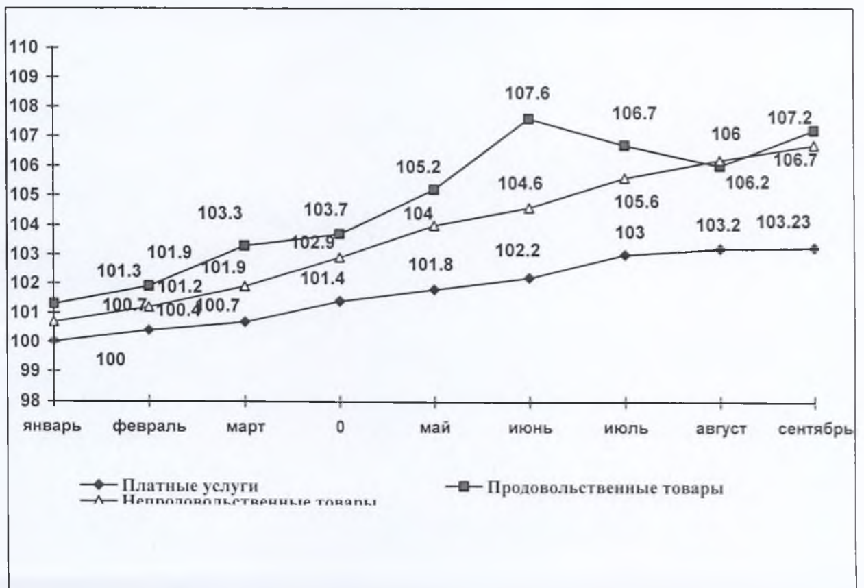
График изменения цен тарифов на товары народного потребления и платные услуги населению в сентябре 2021 года.