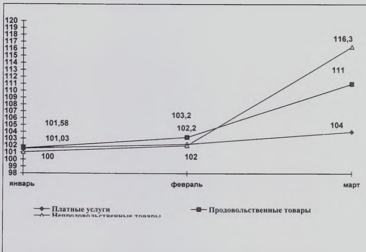
График изменения цен тарифов на товары народного потребления и платные услуги населению в марте 2022 года.