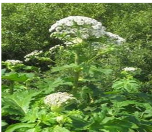
Рисунок 3 – Цветущие растения переходят к цветению в начале лета

Соцветие борщевика называют зонтиком (рисунок 3). После формирования семенного потомства цветоносный побег отмирает совместно с подземной частью растения и корневой системой (рисунок 4).