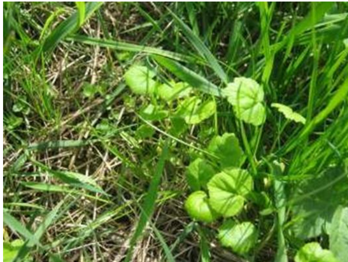
Рисунок 1 – Молодые растения борщевика Сосновского Семена борщевика прорастают с ранней весны в течение всего вегетационного периода

С появлением третьего настоящего листа семядоли желтеют и отмирают. Пластинка третьего листа уже трехраздельная, парные доли двулопастные, верхняя – трехлопастная. С появлением 4-го листа отмирает первый. Далее с появлением очередного листа, отмирает очередной старый лист. Обычно к середине лета отмирает 3-й настоящий лист, и растение представляет собой розетку, образованную 4-м, 5-м и 6-м листьями. Седьмой, восьмой и девятый листья называют листьями осенней генерации и они формируются и функционируют вплоть до появления снежного покрова.