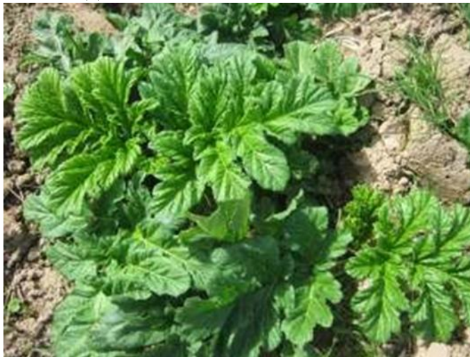
Рисунок 2 – Розетка листьев

трогается в рост. Как только сойдет снежный покров, на поверхности почвы появляются плотно сложенные вдоль жилок, верхушки первых двух листьев, затем появляются 3-й и 4-й листья (рисунок 2). К концу мая обычно первый лист желтеет и отмирает, появляется 5-й лист. В начале августа у растений начинается активный рост 3-й тройки листьев, которые продолжают ассимилировать вплоть до появления снега.