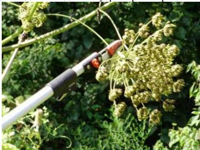
Рисунок 6 – Удаление цветоносов

3. Одним из методов борьбы с борщевиком Сосновского является срезание цветущих растений во время цветения. Борщевики размножаются только семенами. С учетом их высокой семенной способности, удаление цветущих растений должно рассматриваться как первоочередная мера борьбы с борщевиками, особенно одиночными экземплярами. Для удаления побегов можно использовать секатор-сучкорез на длинном шесте, что позволяет удалять цветоносы без контакта с растением (рисунок 6). Уничтожение соцветий может быть также эффективно, как и уничтожение растений целиком, но часто этот метод не дает нужного результата. Растения быстро регенерируют, у них появляются новые соцветия, и они успевают произвести семена. Решающую роль здесь играет время срезания, поскольку, если начать слишком рано (до того, как они полностью расцветут), регенерация будет очень сильной, и семян будет произведено даже больше, чем обычно. Если начать позже (когда уже вызревают семена), велик риск того, что семена созреют в уже срезанных растениях и останутся лежать в земле. Поэтому срезанные растения необходимо уничтожить. Самое подходящее время для удаления соцветий – когда крайние цветки начали распускаться. Однако даже тогда есть угроза регенерации.