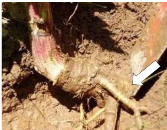
Рисунок 5 – Подрезание растений Срезать борщевик необходимо на уровне 10-15 см ниже уровня почвы

Если растение не погибло, необходимо еще раз его подрезать при возобновлении роста. Перерубленные части растений либо уничтожают, либо оставляют высыхать. Этот метод очень эффективен, но он требует больших затрат труда и рекомендуется только в тех случаях, когда мы имеем дело с единичными растениями или небольшой популяцией (до 200 растений).