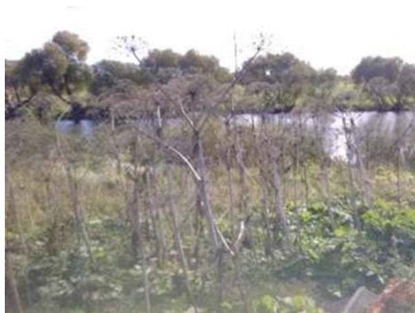
Рисунок 4 – Высохшие стебли растения после образования семян в конце лета отмирают